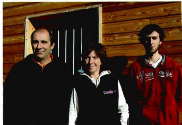
C'est dans ce petit chalet en bois que sont créés et assemblés les produits de l'entreprise familiale Beringer.