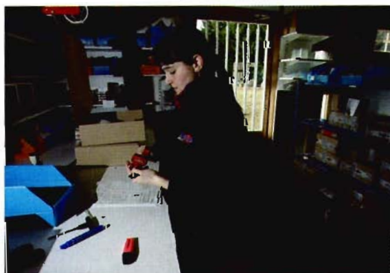
Un ultime contrôle minutieux avant l'expédition à l'autre bout du monde.

La société voit le jour en 1985, déjà à Chatelneuf dans la Loire, en mettant au point une gamme de roues et de fourches adaptées aux side-cars et en important des side-