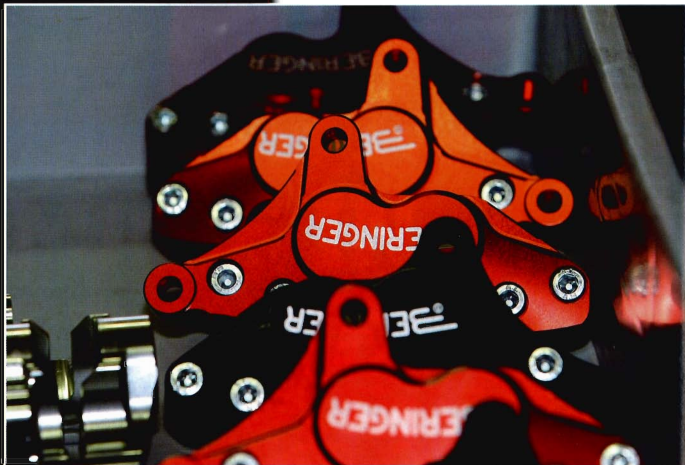
L'anodisation des pièces apporte indéniablement un plus au look Beringer.

Une organisation rigoureuse dans la salle des pièces détachées pour éviter la rupture de stock.