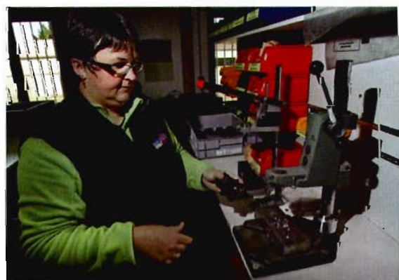
Outillage spécialisé, main d'œuvre qualifiée sont les gages de qualité Beringer.