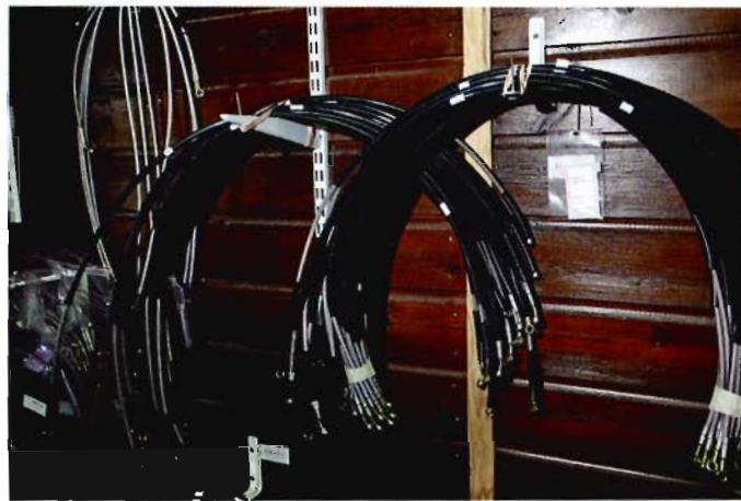
Les durites aviation sont le complément indispensable d'un freinage puissant.

nombreux teams ne jurent que par Beringer. Le quad n'échappe pas à la règle. Les teams Ligier compétition, Race Suzuki, WTec, Quad 80 ou encore Polaris portent les couleurs Beringer.