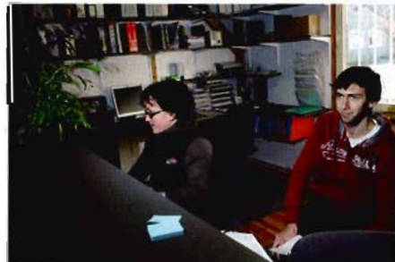
Pas une minute de répit pour le personnel.