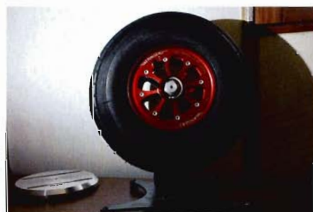
Le système de freinage est intégré à la roue. Celle-ci sera destinée à un avion.

« Look, puissance, voilà de quoi équiper votre machine préférée. »